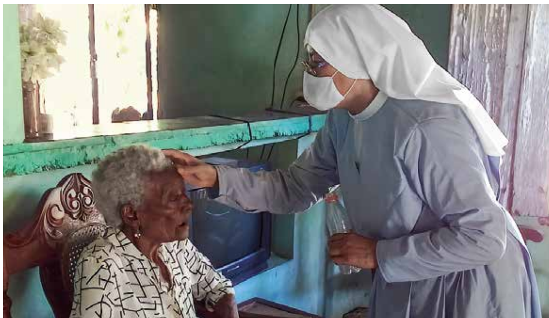
Una monja de Corralillo cuidando a una enferma.

la Iglesia es muy importante divulgar la fe y ayudar a las personas necesitadas, con el fin de que los fieles se sientan apoyados y puedan recobrar el ánimo. Pero la Iglesia se enfrenta a grandes problemas tanto en el cumplimiento de su apostolado como en el área de la atención pastoral. Aunque aproximadamente el 70% de los habitantes están bautizados, muy pocos de ellos participan activamente en la vida de la Iglesia. El arzobispo de Santiago estima que solo alrededor de un 1% de las personas bautizadas acuden a la Santa Misa. ACN apoya a la Iglesia en Cuba para que pueda cumplir su labor en estas difíciles condiciones. Así, en 2021 se proporcionó ayuda con la formación de sacerdotes, la renovación de iglesias y la reparación de vehículos. Además, numerosas religiosas reciben ayuda económica con regularidad.