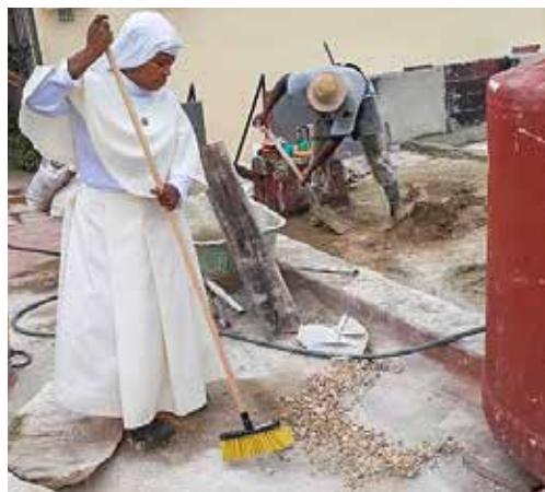
Monjas del convento de las “Siervas de María” durante la reforma de un tejado.

No obstante, la mayoría de cubanos hace mucho tiempo que han perdido la fe en que se produzca una mejora de su situación. La pandemia ha empeorado aún más esta situación. A muchas personas les falta lo más necesario. Por eso, para