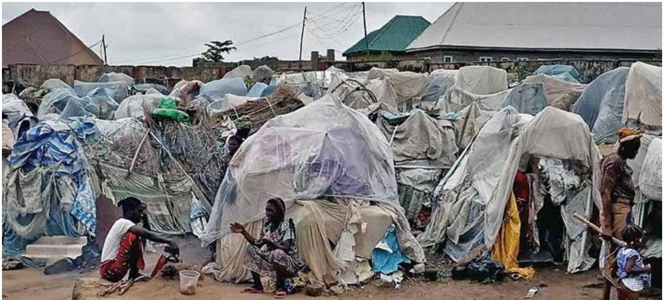
Alojamientos temporales improvisados en un campamento no oficial junto a Ichwa, al norte de Makurdi.

contra los cristianos. Según él, el objetivo de los yihadistas es “islamizar todas las regiones mayoritariamente cristianas”. Con el fin de ofrecer ayuda profesional a los cristianos que han vivido muy de cerca esos brutales actos violentos, ACN participa en la financiación del “Centro de recursos humanos y capacitación para la curación de traumas” de la diócesis de Maiduguri, donde las personas traumatizadas podrán recibir atención psicológica y espiritual.