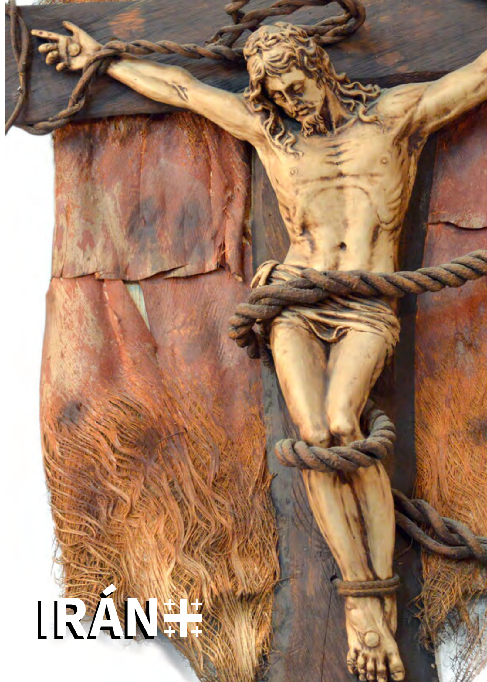
Foto: La cruz en la pared. Iglesia católica armenia en Teherán (Fragmento).. ACN

Señor, pequé. Ten piedad y misericordia de mí.