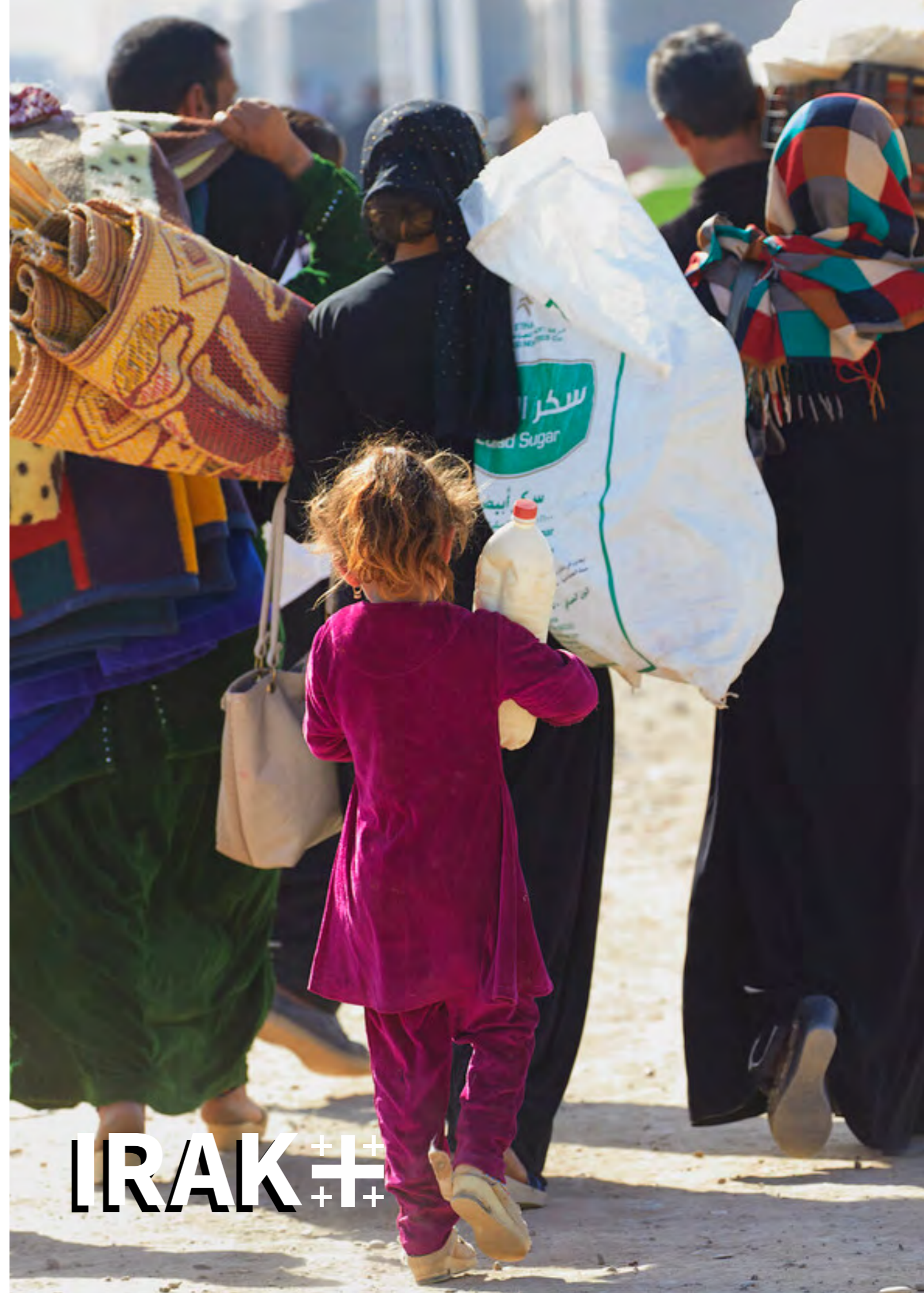
Foto: Refugiados saliendo de Mosul hacia el campo de Khazer tras la liberación del Daesh, 2016. Jaco Klamer, klamer-steel.nl

Señor, pequé. Ten piedad y misericordia de mí.