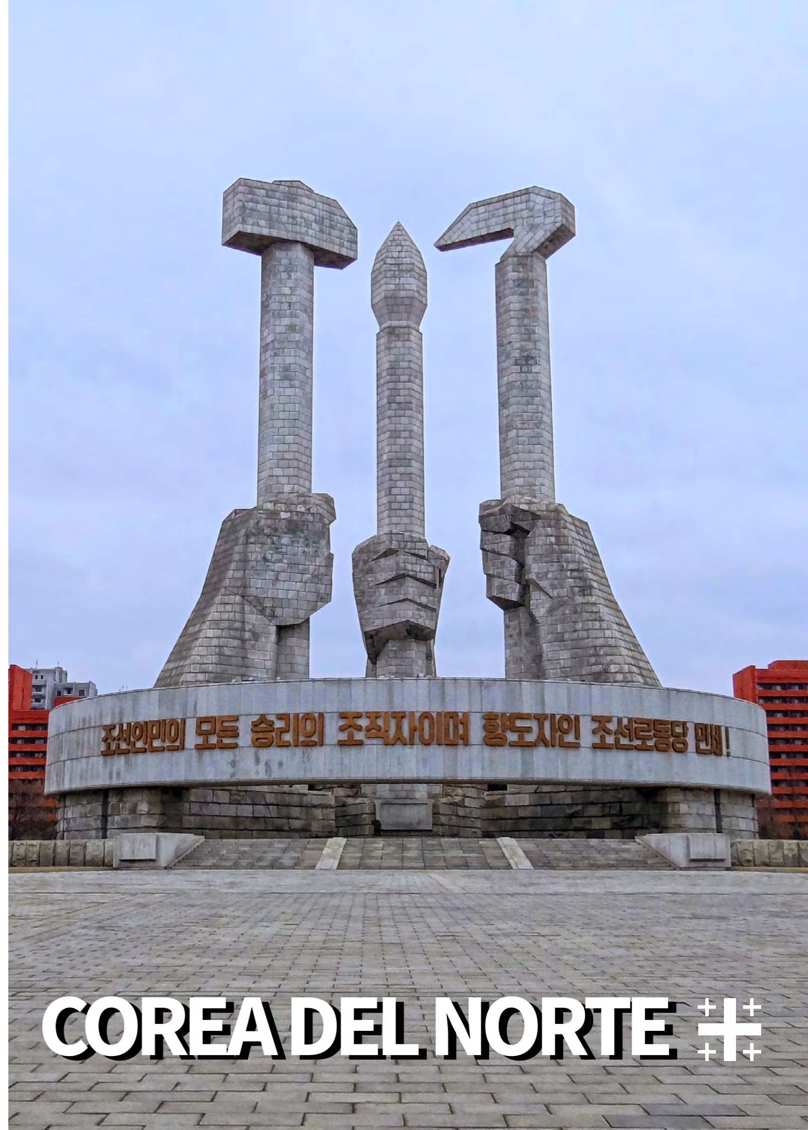
Foto: Monumento a la fundación del partido.

Señor, pequé. Ten piedad y misericordia de mí.