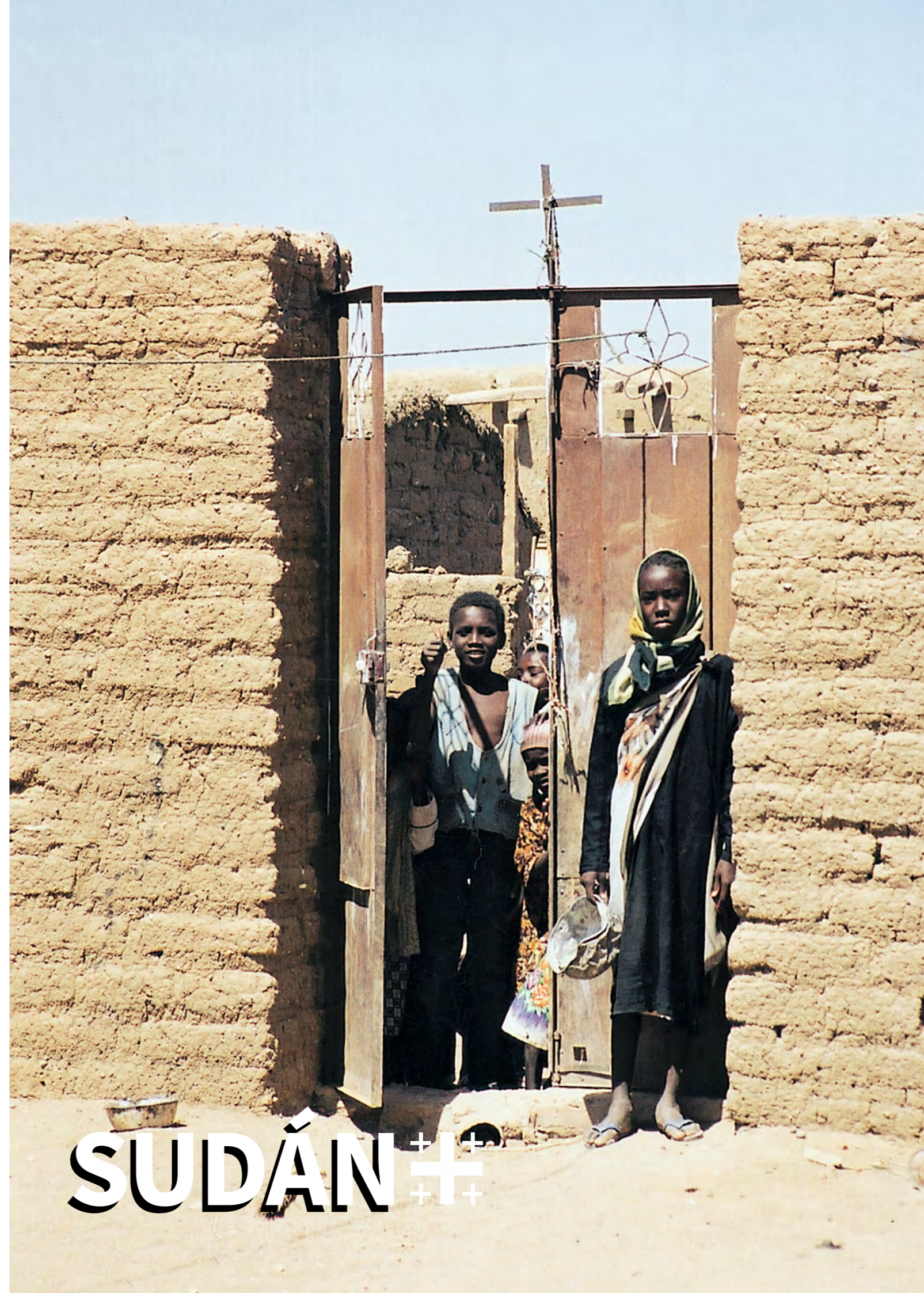
Foto: Niños cristianos sudaneses a la entrada del campo de refugiados. Durante las décadas de guerra civil entre el norte islámico y el sur mayoritariamente cristiano, los cristianos han sido los que más han sufrido.

Señor, pequé. Ten piedad y misericordia de mí.