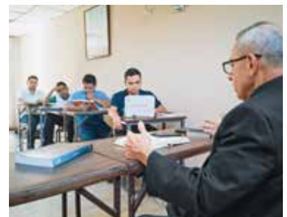
Seminaristas en el seminario sacerdotal de La Guaira.

La miseria económica está forzando a muchas personas a ganarse la vida realizando actividades ilegales si no pueden subsistir con transferencias procedentes del extranjero. Eso ha hecho que el crimen organizado y el tráfico de drogas haya aumentado mucho en los últimos años. Según los datos de las Naciones Unidas, más de siete millones de venezolanos han abandonado su país, lo que ha provocado que el número de habitantes se reduzca hasta los 26 millones. Dado que entre los emigrantes hay numerosas personas jóvenes, el promedio de edad aumenta en la población.