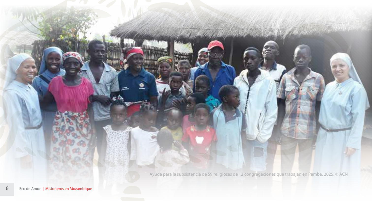
Ayuda para la subsistencia de 59 religiosas de 12 congregaciones que trabajan en Pemba, 2025.

A estas 59 valientes mujeres que, con su amor, intentan sanar las heridas provocadas por el odio y la violencia, les hemos prometido una ayuda para su sustento de $700 dólares por religiosa para este año. ¿Te gustaría contribuir a que las religiosas de la diócesis de Pemba puedan seguir siendo ángeles salvadores de los más débiles?